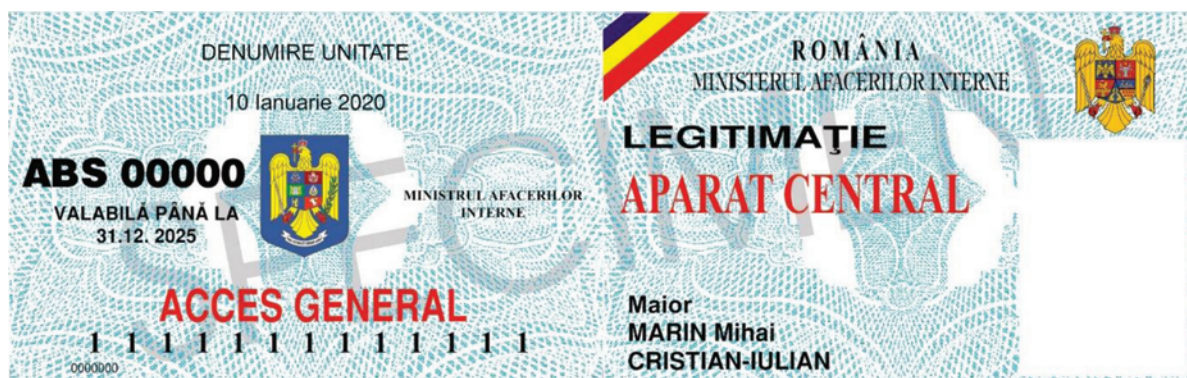
FIGURA Nr. 2