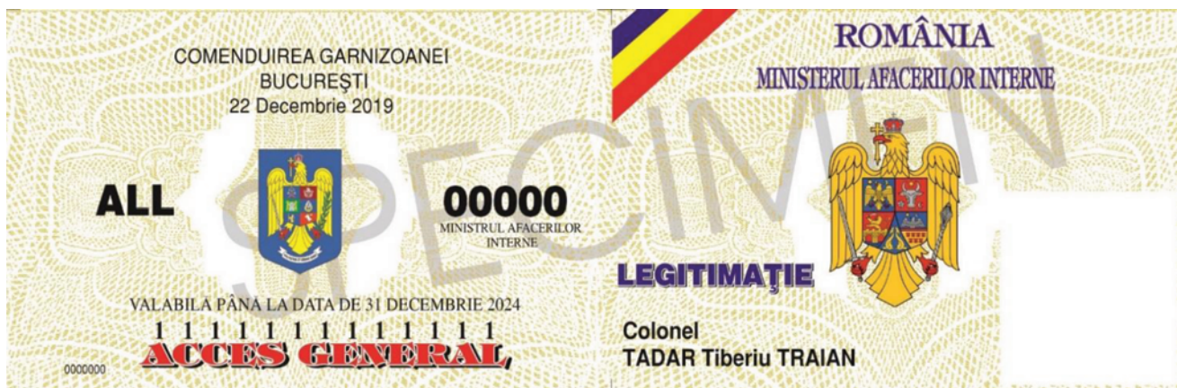
FIGURA Nr. 4